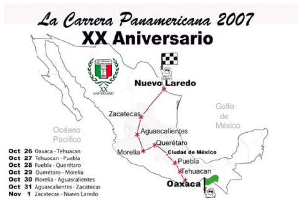
Foto 2: 3.077 km quer durch Mexico, die mexikanische PanAm im Jubiläumsjahr 2007 - davon sind wir natürlich noch weit entfernt.

Am 27. Oktober dröhnen die amerikanischen V8 und schlanken, rassigen Sportwagen der 50er Jahre nicht nur in Mexiko. Parallel zur „großen“ PanAm (26.10-1.11.2007) wird in Duisburg die Carrera Panamericana für Slotcars veranstaltet, an dem sich definitiv nur die Oldies aus den Jahren 1950 bis 1960 messen dürfen.