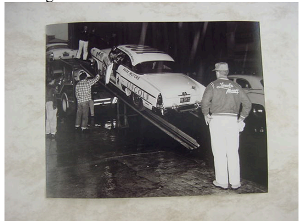
Foto 3: Die ersten Fahrzeuge werden sicher für die strapaziöse Reise nach Duisburg verladen

Die Kasseler Panamericaner Freunde haben ihr Kommen bereits frühzeitig angesagt und freuen sich schon wieder auf einen schönen Renntag mit stark mexikanischem Flair.