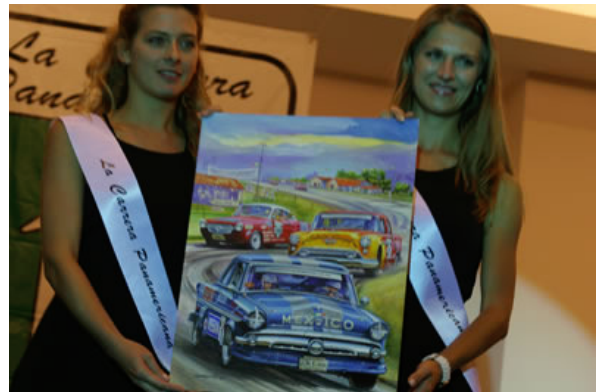
Foto7: Ob die beiden Mädels wohl auch den Weg nach Duisburg finden ?

Wer sich vorab schon mal ein wenig auf das Ereignis einstimmen möchte, wird übrigens hier fündig: Video PanAm