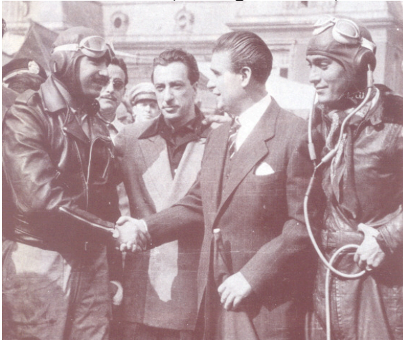
Foto 5: Fahrer/Beifahrer Kommunikation aus dem letzten Jahrhundert

Wie in 2006 können aber natürlich nicht nur Panamericana Fahrzeuge an den Start gehen. Erlaubt ist, was Spaß macht und so in den 50er Jahren gefahren ist bzw. hätte fahren können. Wir freuen uns aber dennoch über jedes Original Fahrzeug aus diesem Jahrzehnt, samt ihren tollkühnen slottern (im Originaldress?).